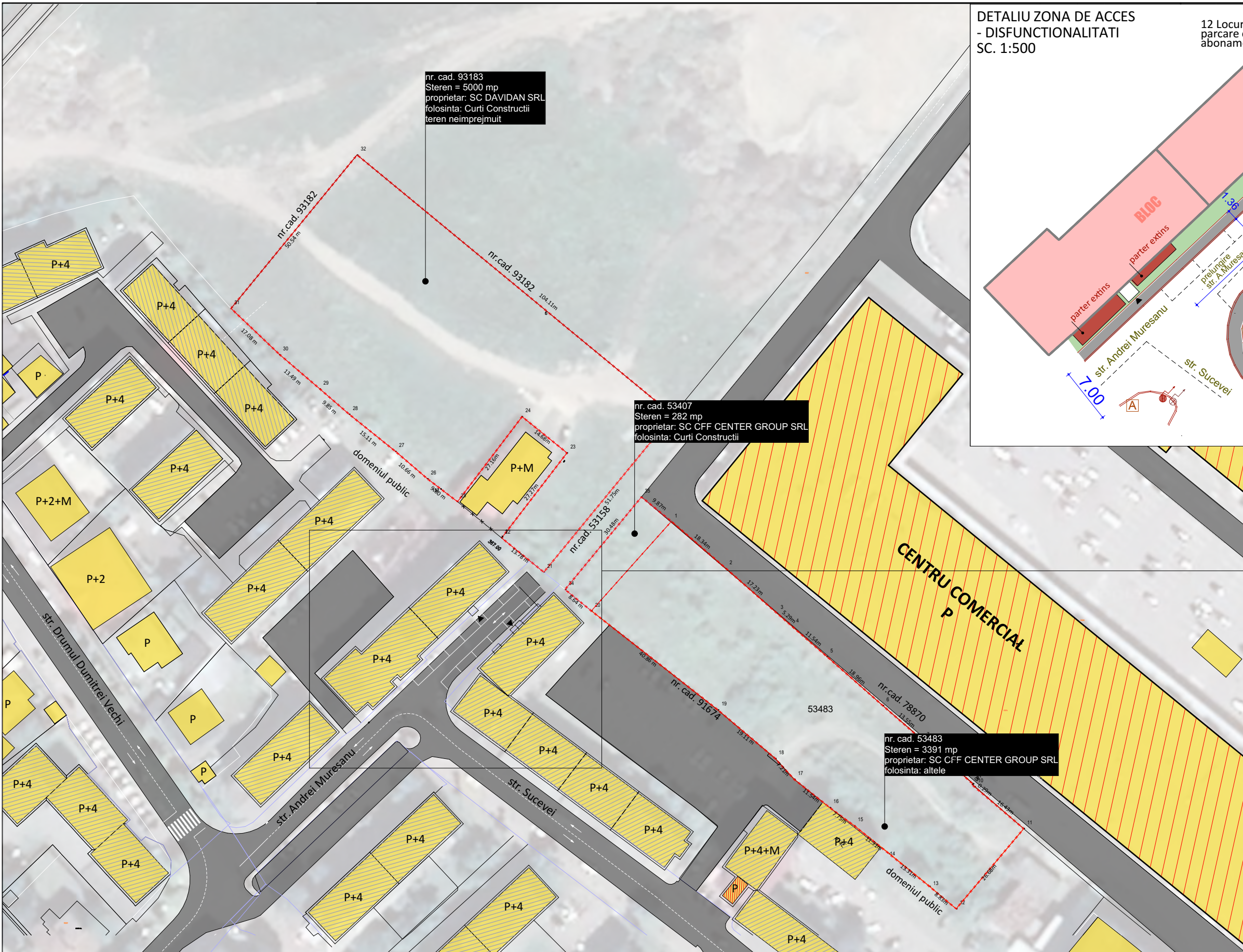
DETALIU ZONA DE ACCES - DISFUNCTIONALITATI SC. 1:500